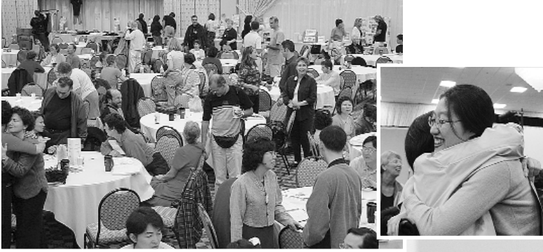
아빠라는 진실을 향한 길이며, 거짓으로 시작되지 않는다.